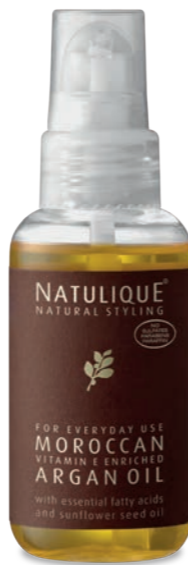
NATULIQUE MOROCCAN ARGAN OIL Rico en Vitamina E, ácidos grasos esenciales y otros nutrientes vitales. Suaviza, hidrata y humedece el cabello mientras que ayuda a alisar las puntas abiertas y el encrespamiento, dejando el cabello suave y sedoso.