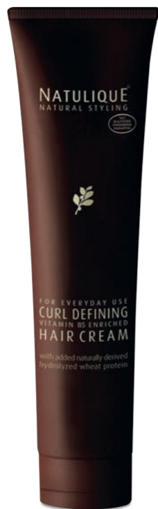
NATULIQUE CURL DEFINING HAIR CREAM Desarrollada especialmente para optimizar, definir y mantener los rizos. Esta crema nutre ligeramente y da un brillo óptimo al cabello de las raíces a las puntas.