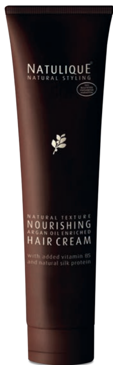
NATULIQUE NOURISHING HAIR CREAM Formulada especialmente con aceite de Argán, proteína de seda natural y la vitamina B5 para nutrir profundamente y proteger el cabello, asegurando un aspecto natural y brillante.

menos productos químicos e ingredientes mucho más naturales, mejores resultados